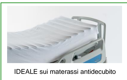
IDEALE sui materassi antidecubito